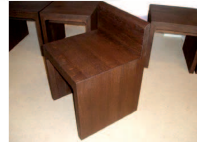
Chorgestühl, Priestersedilien, Kirchenbänke - und auch die Ausstattung von Sakristei und Vorhalle werden aus dunkel gebeizter Eiche gefertigt.