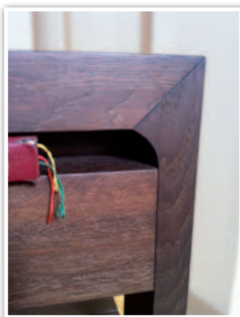
Auf die Ausstattung seiner Räume legt unser Architekt John Pawson besonderen Wert. Das neue Kirchengestühl von St. Moritz soll klar und zweckmäßig sein und trotzdem zu Ruhe und Sammlung einladen.

wählen sollten. Ich gebe zu, dass ich aufgrund meiner Erfahrungen in Frankreich zunächst sehr stark die Stühle favorisierte. Die Möglichkeit, damit in Zukunft sehr flexible Raumgestaltungen vornehmen zu können, faszinierte mich. Nach ersten Gesprächen mit unseren Architekten vom Büro Pawson wurde mir aber schnell klar, dass dort die Bänke bevorzugt wurden. Pawson will mit seinem Ansatz der Reduktion auf das Wesentliche im Raum vor allem Klarheit und Ruhe erzeugen. Die Stühle aber würden diesen Eindruck eher trüben denn